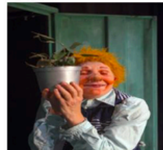
Cie Batchata « Unpuissant »