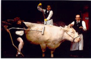
Cie extrêmement prétentieuse