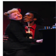
Cie Batchata « Tigra »

Parallèlement à mon expérience de la scène, j'ai développé une pédagogie autour du style clownesque depuis 35 ans; et accompagné des projets en tant que regard extérieur et metteuse en scène. Dernièrement j'anime une conférence sur le clown.