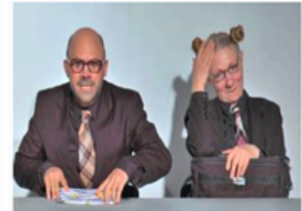
Cie Batchata «C.affaires »