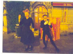
Cie Batchata « ange »