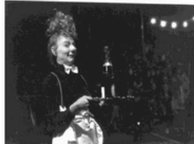
Cirque du docteur Paradi